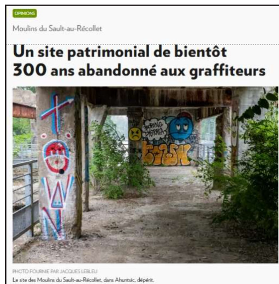
La Presse - Opinions - 19 octobre 2025